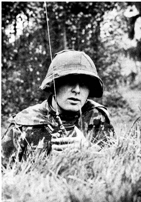
Die Gefechtsordnanz des Zugführers in Verbindung mit dem Kompaniekommandant mit der Station SE-125

Bereits 1924 wurde der Uebermittlungsdienst der Infanterie erweitert und zu den Telefonisten gesellten sich die Signalsoldaten der Infanterie. Welche mit der Signallampe und den Signalflaggen «Depeschen» mit Morsezeichen übermittelten. Rekrutenschulen für Telefon- und Signalpatrouillen