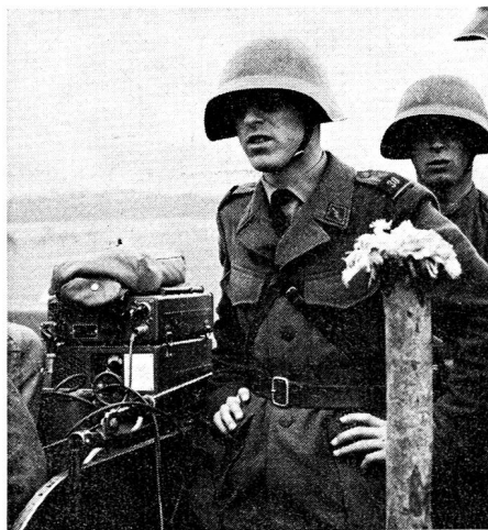
Der Bataillonskommandant mit seiner Begleitfunkstation im Bataillons-Führungsnetz TO-61; SE-206, die ersten voll motorisierten Stationen

nützer es gestatten, Draht und Funk miteinander zu betreiben und auszunützen. Ein Kommandant, der in einer Situation nur noch über seine persönliche Begleitfunkstation verfügt, muss mit seinem Vorgesetzten, Untergebenen oder Nachbar sprechen können, der im selben Moment nur noch über eine Telefonverbindung verfügt. — Hoffen wir auch, dass bald einmal die grosse Lücke im Befehls- und Nachrichtenapparat, nämlich die sichere und automatische Sprachverschleierung, wo der Uebermittler mit der Verschleierung selber nichts mehr zu tun hat und der Inhalt der Uebermittlung durch das Tarnverfahren nicht mehr entstellt wird, geschlossen werden kann. er