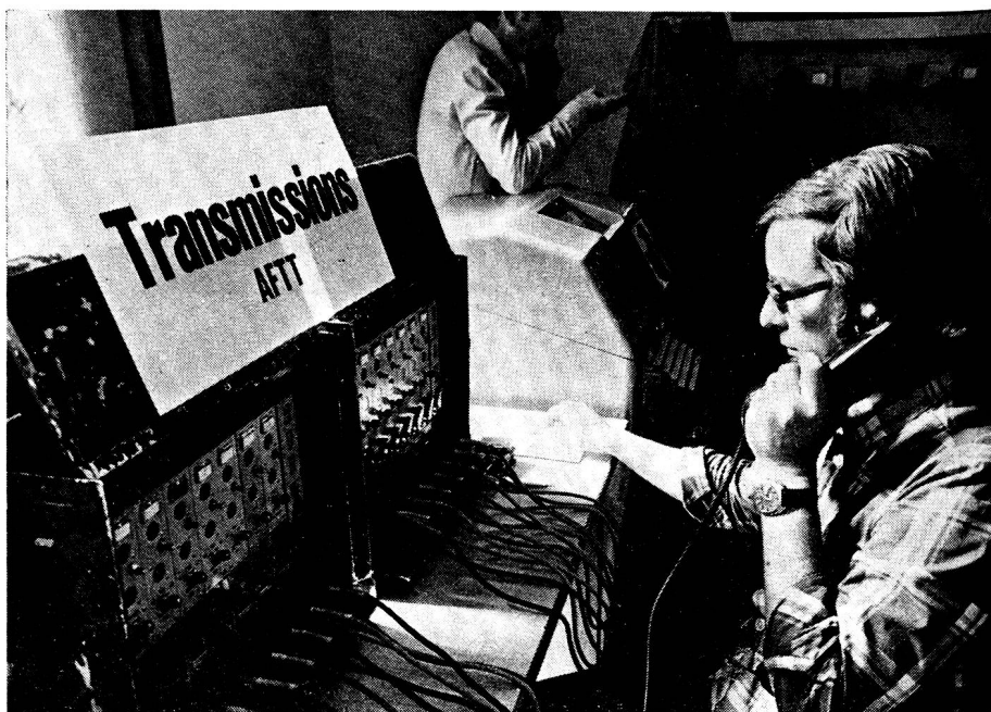
Section La Chaux-de-Fonds: Vue partielle du centre de transmission de la Braderie.