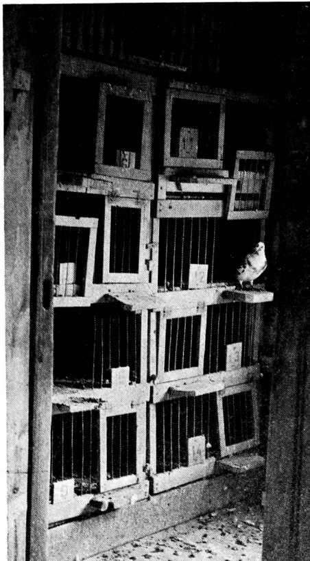
Sicht in einen Teil des Taubenschlages (Brutstätte).

A part cette activité au profit de l'armée, les pigeons sont entraînés également à des performances intéressant le civil. Ils