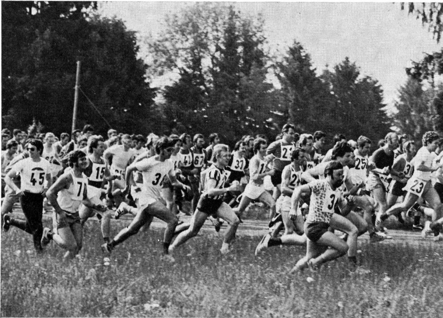
Markantes Zeichen des 9. Schweiz. Mannschaftswettkampfs der Uebermittlungstruppen (SMUT), der am 22. und 23. Mai 1976 in Bülach ausgetragen wurde, war der Jubiläumslauf zum 25jährigen Bestehen der Abteilung für Uebermittlungstruppen. Bild