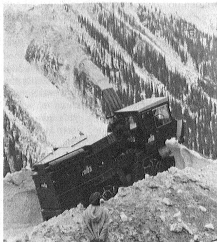
Ein Schweizer Schneeräumfahrzeug der Firma Rolba AG im Einsatz.

Mit den deutschen Unternehmen Mannesmann-Demag unterhält die Rolba AG seit Jahren eine Zusammenarbeitvereinbarung auf dem zukunftsträchtigen Gebiet von Sport- und Freizeitanlagen. Die Jubilarin beschäftigt weltweit 650 Mitarbeiter und erzielte 1978 einen Umsatz von 115 Mio. Franken. ●