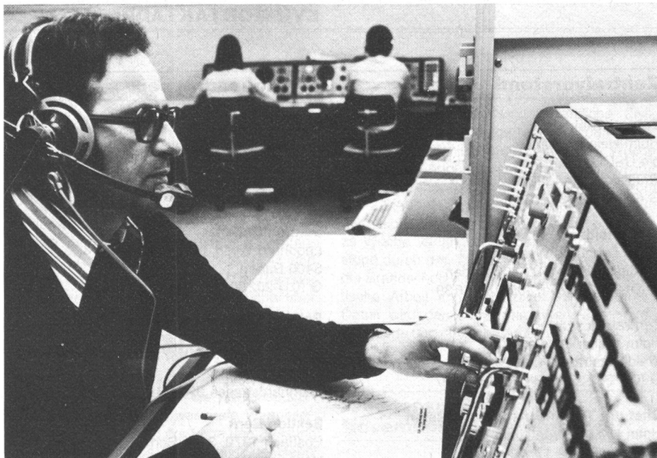
Das Bild zeigt einen Telefonie-Vermittlungsplatz der Küstenfunkstelle Bern Radio; Sender und Empfänger werden ferngesteuert. Im Hintergrund sind zwei Telegrafie-Arbeitsplätze sichtbar.

os. Der Funkverkehr in Not-, Dringlichkeits- und Sicherheitsfällen stützt sich weitgehend auf die Mittelwellen. Eigentliche Notfrequenzen sind 500 kHz und 2182 kHz. Auf den Schiffen und Küstenfunkstellen müssen diese ständig überwacht werden, während der Dienstzeiten durch eine Hörwache und ausserhalb dieser Zeiten durch einen sogenannten Autoalarm . Jedem Notruf geht ein Alarmzeichen voraus. Es besteht aus zwölf Strichen von vier Sekunden Länge; die Abstände zwischen den Zeichen betragen eine Sekunde. Empfängt der Autoalarm vier aufeinanderfolgende Striche, löst er selbständig einen akkustischen Alarm im Funkraum, dem Schlafrum des Funkers und auf der Brücke aus. Auf diese Weise kann der herbeigerufene Funker an seinem Empfänger den anschliessenden SOS-Notruf empfangen. ●