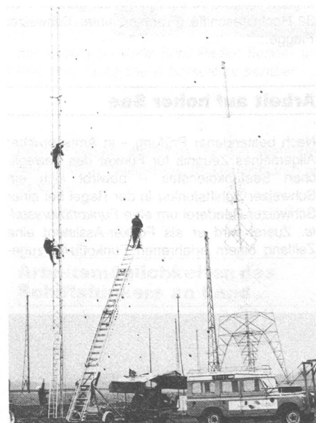
Durch die Dislokation der Sendeanlagen von Münchenbuchsee nach Prangins mussten zahlreiche Antennen neu aufgebaut werden.

Früher fehlten in der Schweiz Ausbildungsmöglichkeiten für Schiffsfunker. Interessenten hatten nur die Möglichkeit, eine ausländische Funkerschule (meistens die Seefahrtsschule in Bremen) zu besuchen. Die ausländischen Funkerschulen konnten aber nur jährlich 2–4 schweizerische Kandidaten berücksichtigen, so dass ein ausgesprochener Mangel an ausgebildeten schweizerischen Schiffsfunkern entstand. Viktor Colombo , damals von Berufes wegen mit diesen Problemen vertraut, gründete 1960 deshalb die Abendschule für Funker . Das Schulprogramm ist geschickt auf zwei Jahre aufge-