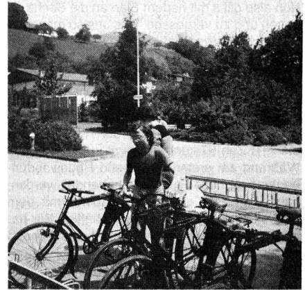
Das neue Übermittlungsmaterial , getestet in der Übung

Bei der Übungsbesprechung zeigten sich der Übungsleiter wie auch die Übungsinspektoren mit dem Einsatz und den gebotenen Leistungen zufrieden.