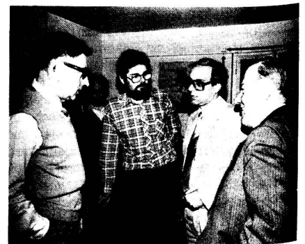
Die «alten Füchse» beim Fachsimpeln

Eine «Nachmittags-Idee» wurde durch das Ausarbeiten eines Drehbuches über das Thema «Funk» verwirklicht. Das Abenteuer begann in den frühen Morgenstunden (bei Mineralwasser und Kerzenlicht, versteht sich), als ich den Technischen Leiter des KRS (Kabelfernsehen der Region Solothurn) überzeugen konnte, dass wir einen Werbefilm über den EVU (respektive Funk) im allgemeinen ausstrahlen sollten. Zu meinem Erstaunen war er einverstanden, und so begann die nervenaufreibende Arbeit hinter und vor der surrenden Kamera. Als die Detailarbeiten soweit fortgeschritten waren, kam der grosse Augenblick der Aufnahmen. Gespannt warteten wir auf das Team mit den Scheinwerfern, Kameras, Kabel,