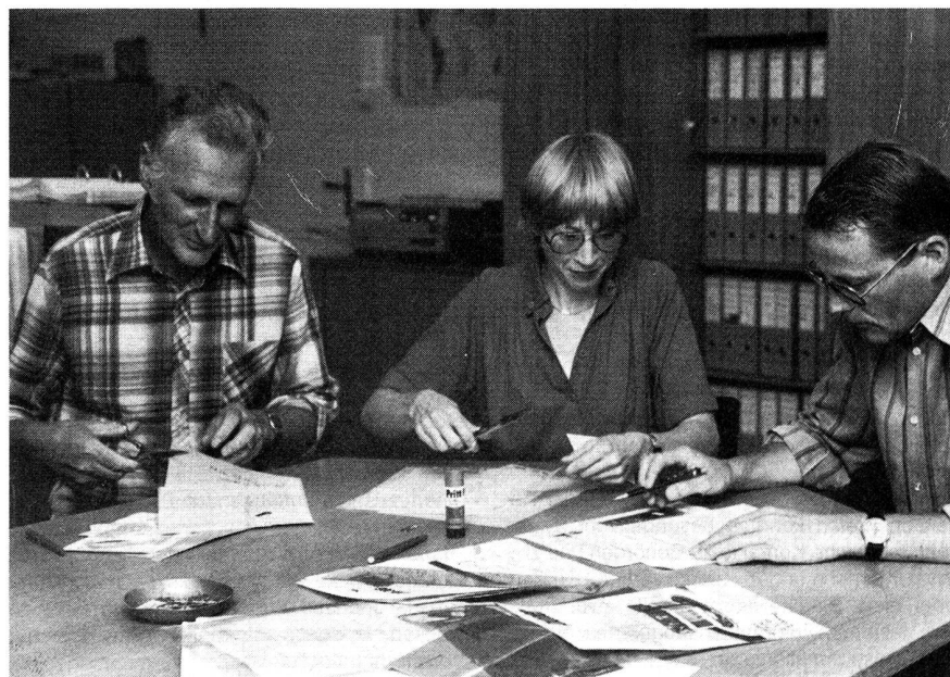
Im «Umbruch» werden Texte und Bilder zu Druckseiten zusammengefügt. Die Papiervorlage dient später als Grundlage für die Filmmontage.

Ohne Inserate, gäbe es keinen PIONIER. Die Mitglieder der Schweiz. Vereinigung der Feldtelegraf-Offiziere und -Unteroffiziere und des