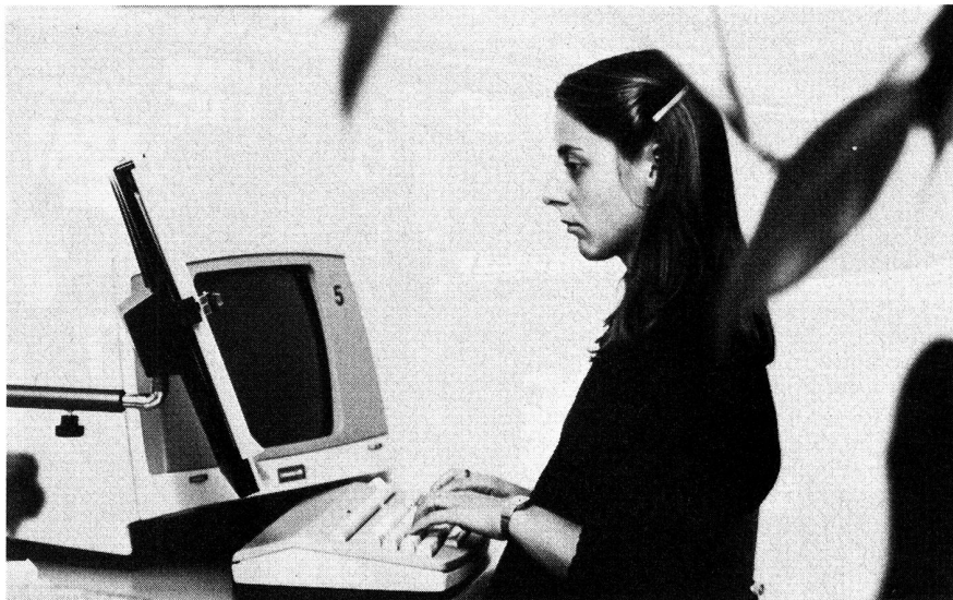
Die aufbereiteten Texte des PIONIER werden an Bildschirmterminalen in den Rechner eingegeben.

Die endgültigen Texte werden auf Film belichtet. Diese gehen in die Kleinmontage. Auf Leuchtputzen werden Filme und Bilder standrechtig mit grosser Präzision zu den Seitenvor-