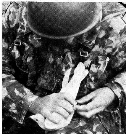
«Prise de liaison» avec pigeons-voyageurs.

Chaque commandant tactique porte la responsabilité du service de transmission dans sa sphère de commandement. Des points renforcés peuvent être créés pour répondre aux objectifs du chef tactique ou opérationnel. Les efforts en matière de liaison sont réalisés par la superposition de divers moyens de transmission, par exemple par la conduite multiple de liaisons et par l'engagement de moyens particulièrement efficaces. Chaque organe de commandement prend, dans sa zone, les mesures de protection électroniques nécessaires.