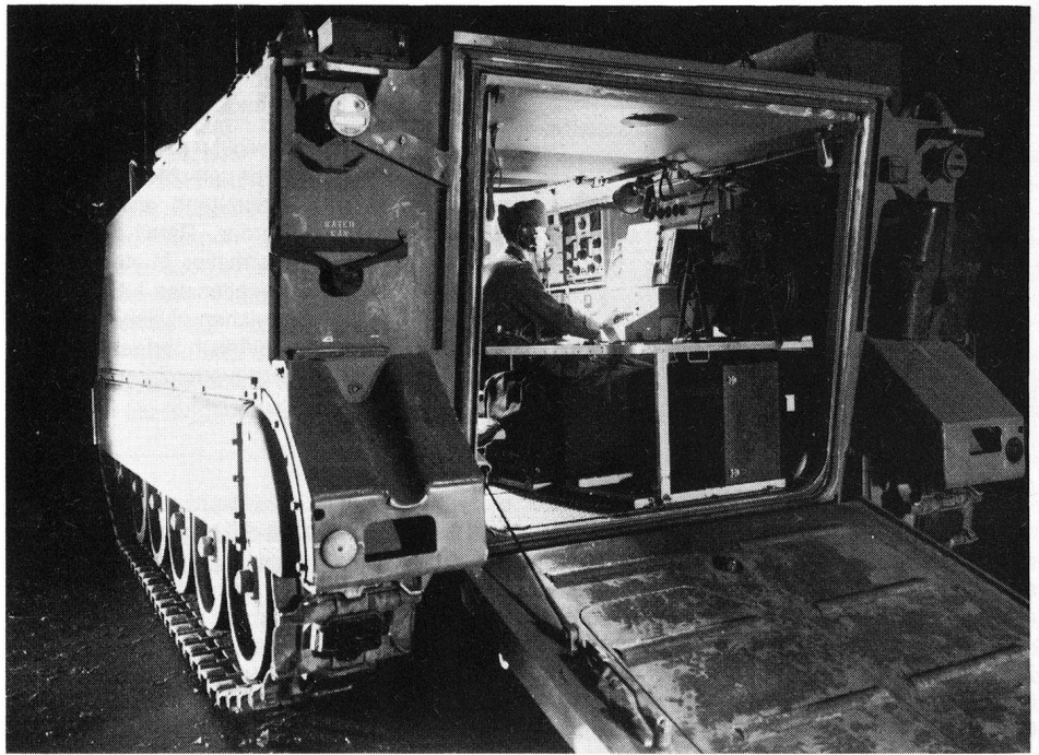
Übermittlungsschützenpanzer mit Funkfernschreiberstation SE-222/KFF

Die technischen Einrichtungen der Übermittlungstruppen transportieren oder verarbeiten Informationen und sind deshalb Angriffspunkte höchsten Interesses für jeden Gegner. Neben der Funktion des selbständigen Fernmeldefachmanns hat deshalb jeder Übermittlungssol-