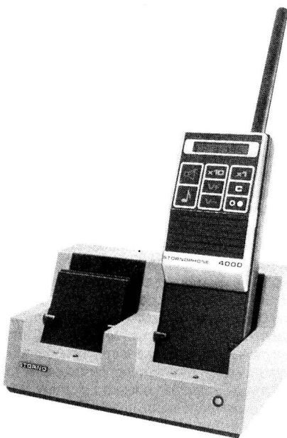
Das 2-Platz-Ladegerät kann 2 komplette Geräte oder 2 Akkus oder eine Kombination von beiden aufnehmen. Während des Ladens bleibt das CQP 4000 voll betriebsfähig.

Für das Stornophone 4000 wurde ein umfangreiches Tonrufprogramm konzipiert. Der Schwerpunkt liegt beim sequenziellen Tonruf nach ZVEI 1, 2, 3, EEA, und CCIR, wobei sieben Tonfolgen und Doppeltelegramme möglich sind. Zusätzlich kann das Gerät mit einem Pilotton CTCSS ausgerüstet werden. Gruppen-, Sammel- und Quittungsruffunktionen können zusätzlich programmiert werden. Beim eingebauten Tonsender können mittels dem Tastenfeld bis zu 100 Tonkombinationen eingestellt werden. Die verschiedenen Rufe werden im Anzeigefeld dargestellt.