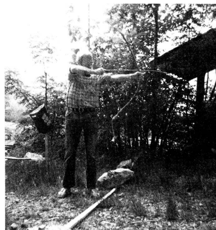
Ob's wohl ein Treffer wird?