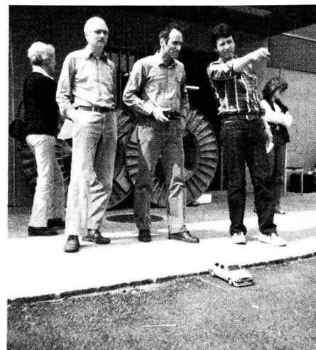
Einmal am Steuer eines Rennwagens.

Überraschenderweise waren auch etliche Ftg-Götter unserer Veranstaltung wohlgesinnt, versprach doch der Tag nach tagelanger Kälte und ausgiebiger Nässe angenehm trocken und warm zu werden.