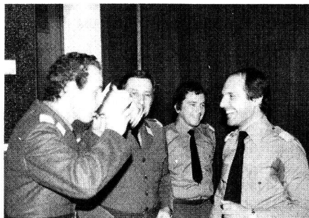
Le nouveau Comité central (GL Bellinzone)