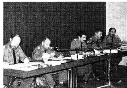
Le Comité central sortant (GL Genève)