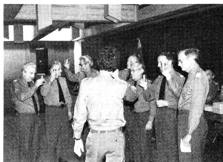
Nomination des vétérans (classe 1923)

Cette assemblée générale, le comité central a voulu l'organiser sur deux jours. Ce n'était évidemment pas la solution la plus facile, mais en entendant les échos et les avis de certains participants, on peut objectivement penser que ces deux jours furent une réussite.