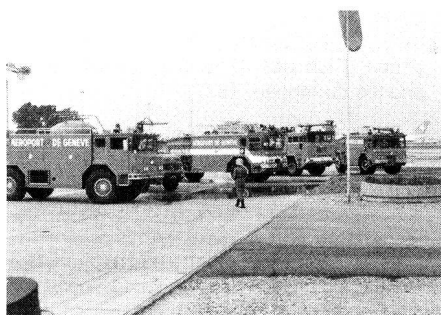
Démonstration du Service de sécurité de l'Aéroport de Genève-Cointrin