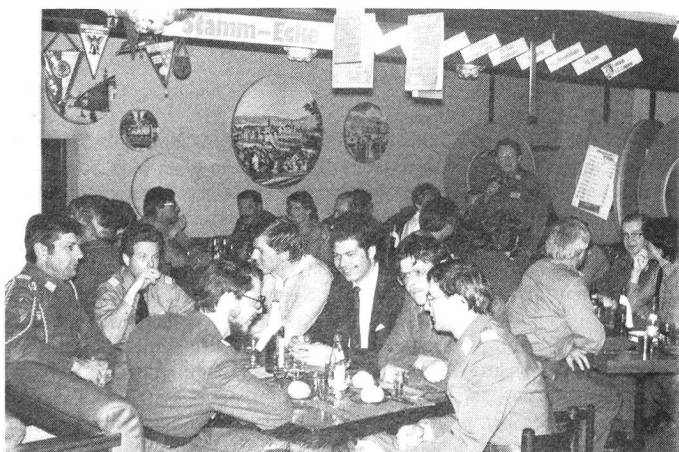
Stimmungsbilder aus der Delegiertenversammlung