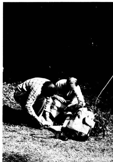
Postenarbeit Unternehmung Rondo

Den Beweis, dass wir etwas gelernt haben, treten wir am 1. September an. Dann verschieben wir uns auf den Lindenberg, wo wir gemein-