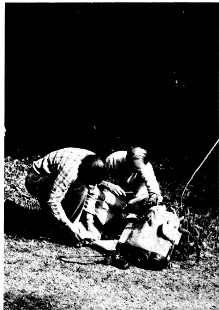
Postenarbeit Unternehmung Rondo

Den Beweis, dass wir etwas gelernt haben, treten wir am 1. September an. Dann verschieben wir uns auf den Lindenberg, wo wir gemein-