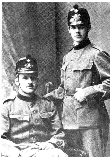
Wie sich die Bilder doch gleichen: Das heutige Tenü Ex (r.) ist – abgesehen von Kragen und Ärmelpatten der Fk Pi von 1920 – fast identisch mit der Ordonnanz 1920...