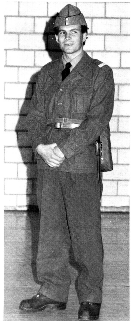
Ab 1986 abzulösen: Tenü Ex der TT Betr Gr

Par la tenue de camouflage 83. Celle-ci servira aussi bien comme tenue de combat à l'extérieur qu'au travail dans les PC et véhicules. En plus, elle sera beaucoup plus agréable à porter – elle est plus légère – que la tenue d'assaut 70 avec son énorme nombre de poches.