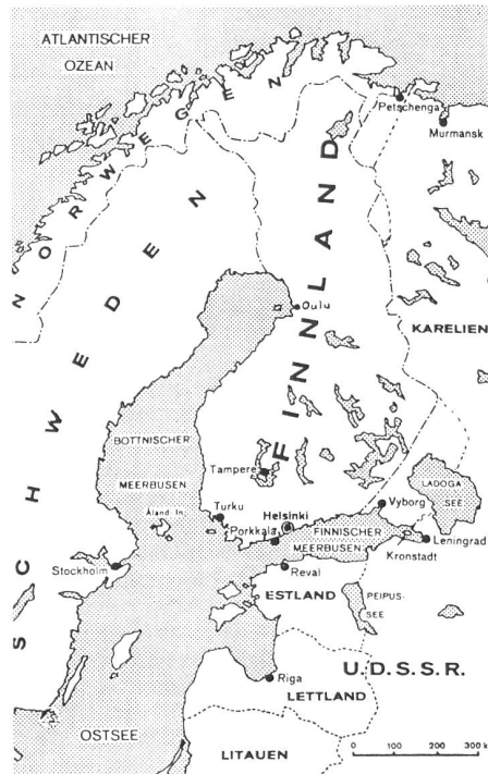
Finnland und die nördliche Ostsee 1944: Bevölkerungszahl 4800 000, Staatsgebiet 337 000 km 2 , Wasserfläche 9%, Wald 57%, Acker 8%, sonstiges 26%. Rechts: Finnische Infanterie heute – Weiterentwicklung bewährter Kampferfahrung.

Art. 2 Die Hohen Vertragsparteien werden untereinander in dem Falle in Verhandlungen treten, dass eine Bedrohung mit einem in Art. 1 gemeinten militärischen Angriff festgestellt ist.