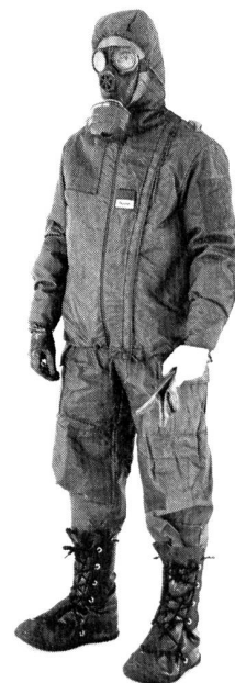
C-Schutzanzug mit Fingerhandschuhen, Baumwoll-Innenhandschuh und Überstiefeln. Einführung für besonders gefährdete Truppen auf 1.1.1988 vorgesehen.

Die Kommission für militärische Landesverteidigung (KML) hat diese Situation klar erkannt. Im nächsten Jahrzehnt sind denn auch respektable Verbesserungen zu erwarten: Als Sofortmassnahme werden 45 000 moderne C-Schutzanzüge mit Fingerhandschuhen und Überstiefeln für besonders gefährdete Truppen beschafft (siehe Bild). Ein ähnlicher Schutzanzug soll in den neunziger Jahren für die ganze Armee eingeführt werden, Truppenversuche