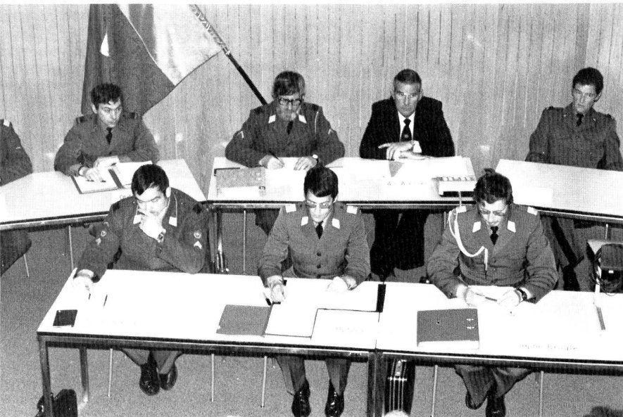
Mitglieder des ZV geben Rechenschaft über das vergangene Verbandsjahr.