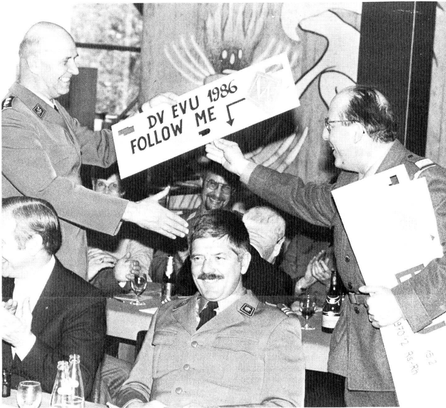
Wer folgt wem?

Pi. Einen ausführlichen Bericht über die Delegiertenversammlung des EVU und die damit verbundenen Jubiläumsfeierlichkeiten der Sektion Biel-Seeland präsentieren wir in der Juni-Ausgabe des PIONIER. In Kürze allerdings eine Kostprobe!