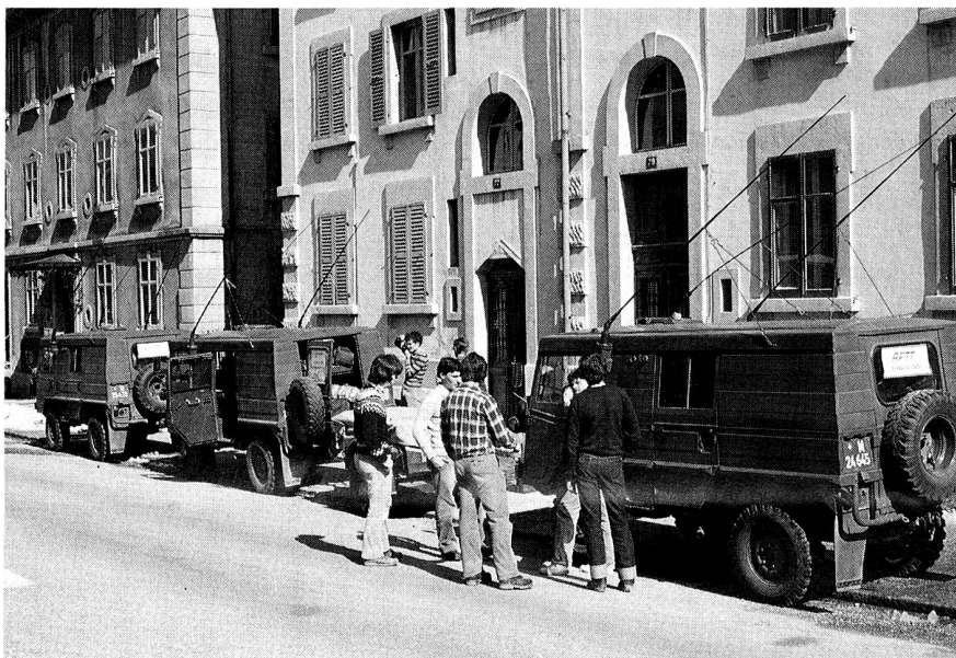
Les grands départs forment la jeunesse!