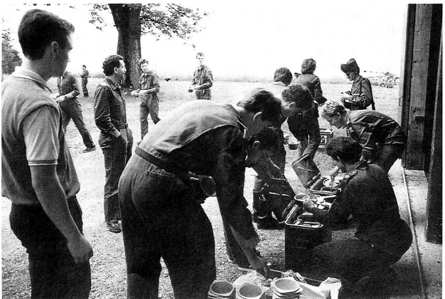
Die Übungsteilnehmer beim Fassen der Verpflegung aus der Militärküche.

Dann, im Sinn der Übungsleiter geht der «OL» alsbald weiter. Man darf nach Koordinaten seinen neuen Standort raten.