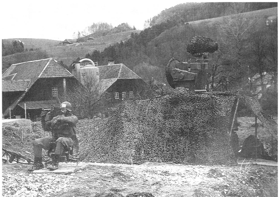
Das Feuerleitgerät 75 Skyguard mit dem optischen Zielzuweisungsgerät.

Alle Flab-Verbände sind eingebettet in die Flab Brigade 33 des Armeekorps für Flieger und Fliegerabwehr. Eine Ausnahme stellen dabei die Rapier -Verbände dar, welche den mechanisierten Divisionen unterstellt sind. In der Brigade 33 sind somit die Abteilungen des Lenkwaffensystems Bloodhound , der mittleren und der leichten Flab eingeteilt.