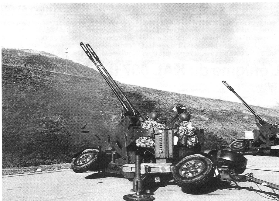
Auf den Schiessplätzen zeigt sich die Qualität der Vorbereitungen.

Das ganze System wird durch vier Mann bedient. Dabei übernimmt ein Offizier oder Unteroffizier die Feuerleitung, ein Soldat die Radarfassung und ein weiterer die Zielverfolgung mit dem Radar oder dem optischen System. Ein dritter Radarsoldat ist für optische Zielzuweisung ausserhalb des Gerätes zuständig.