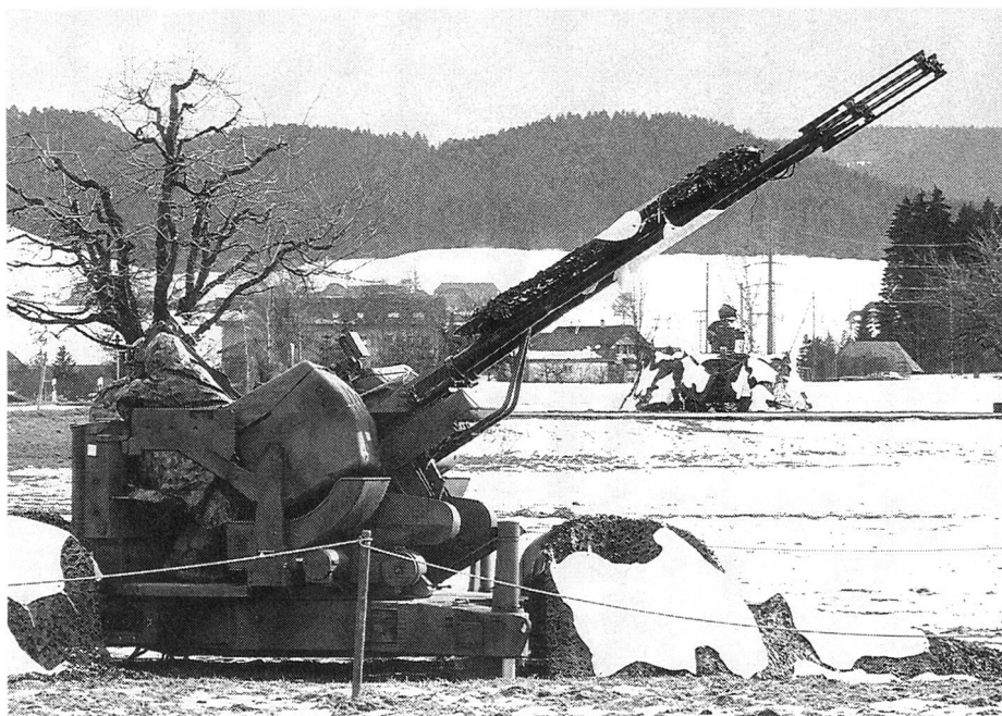
Mit Angriffen aus der Luft muss zu jeder Tages- und Nachtzeit gerechnet werden.

Alle feuerleitenden Offiziere müssen jährlich zu einem mehrtägigen speziellen Simulatorkurs einrücken, in dem die neuesten Änderungen des Systems wiederum gelernt werden und die Feuerleitung als solches durch intensive und anspruchsvolle Übungen wiederholt wird.