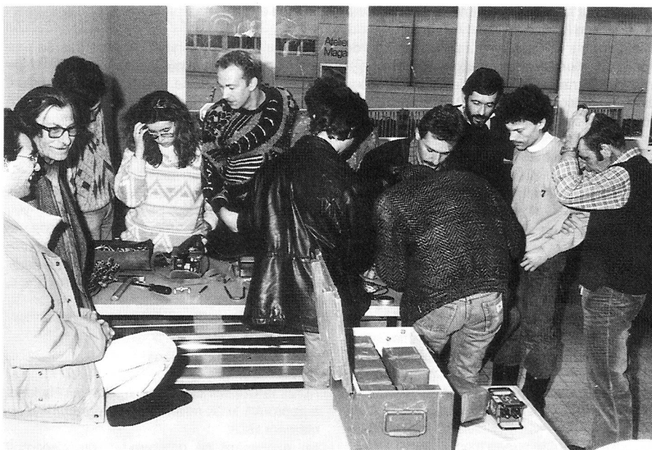
La technique de réparation du câble de campagne a retenu l'attention de tous.