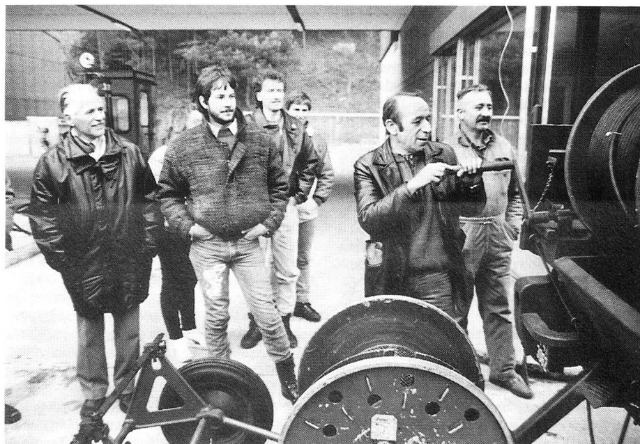
Le président de la section Valais-Chablais présentant la remorque de câble F-20.