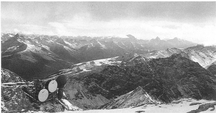
Sul tetto del mondo.