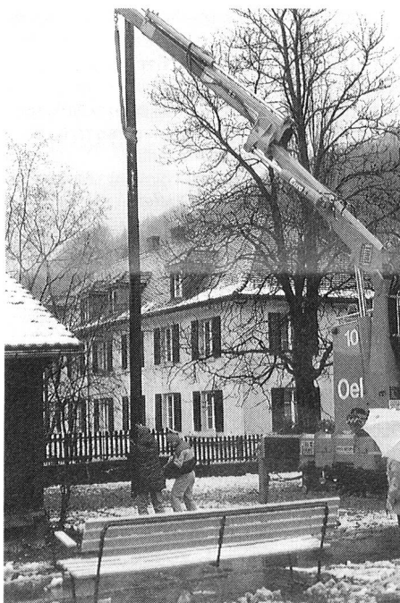
Die Ölwehr stellt Masten

Welche ökologischen Schweinereien macht wohl der EVU, dass die Ölwehr zum Einsatz aufgeboden wird? Zum Glück keine, wie unschwer auf dem Bild ersichtlich ist. Es war den guten Beziehungen von Peter zu verdanken, dass wir für das Stellen des Mastes die Hilfe der Feuerwehr Baden mit ihrem Kran beanspruchen konnten.