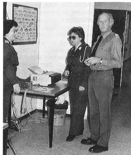
baffo Muto come i pesci; telefax = tranquillità.

Anche se questo esercizio è diventato una questione di ordinaria amministrazione, possiamo dire che ogni volta c'è qualche momento che rende più attenti i presenti, magari anche il responsabile per una questione tecnica. Ma quest'anno si è potuto vedere un apparecchio nuovo, non come tale, ma sul suo inserimento come mezzo di trm. Così abbiamo potuto ammirare il semplice e silenzioso funzionamento del Telefax che collegava il centro trm con l'ufficio spoglio. Una innovazione che ha suscitato un grande apprezzamento da parte degli organizzatori.