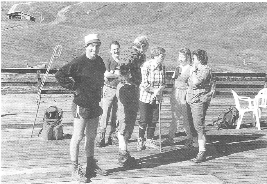
Uno senza, altri con problemi?

E, finalmente, segue la cena finale nello stesso giorno.