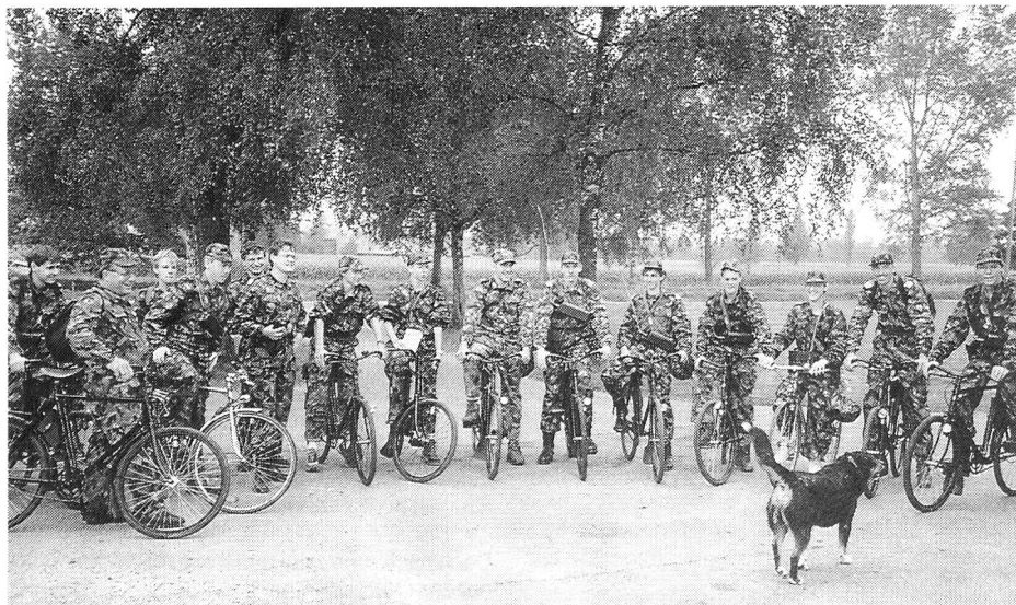
EVU Mittelrheintal für einmal mit dem Fahrrad in den Einsatz (links aussen ZHD René)