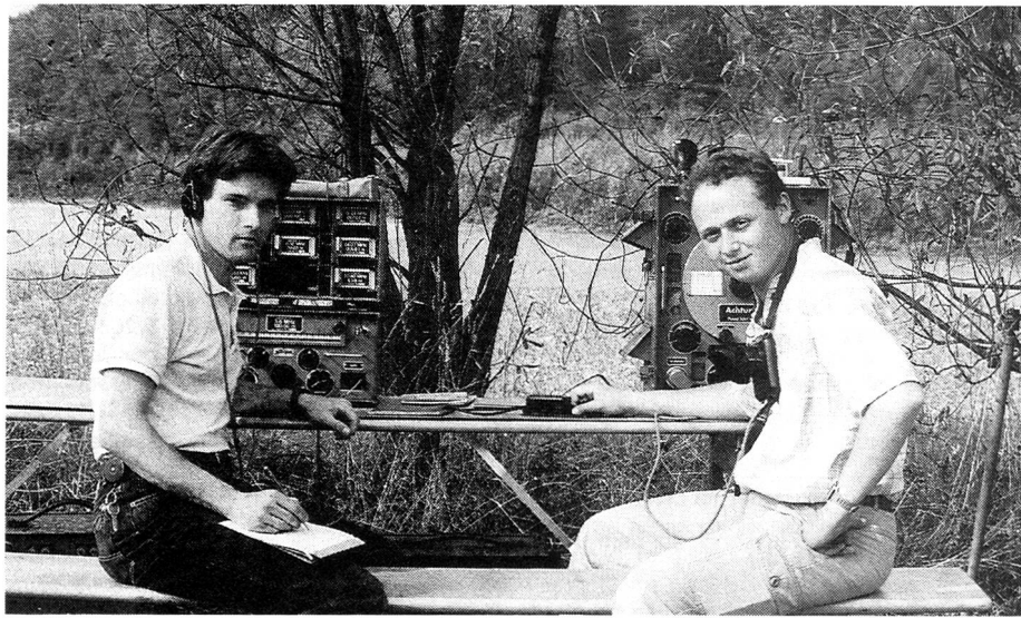
Die Initiatoren des FACB, zwei Firstclass-Funker, vor der FL 40 / TS 40 live.