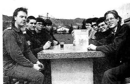
Man zeigt sich auf dem Titelblatt des PIONIER.