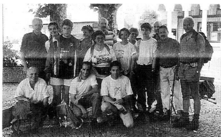
Famiglia sana = nazione sana.

Dopo Colombo, arrivarono eserciti di europei che, con ogni mezzo più basso del disonore, hanno occupato la terra delle popolazioni del sito, cacciando e uccidendo brutalmente la gente indigena, annullando la loro cultura per poi, 500 anni dopo, organizzando mostre e grandi discorsi, inneggiare alle scoperte «dei valori» delle culture di quelle popolazioni che furono, nell'immediato dopo Colombo, miserabilmente distrutte!