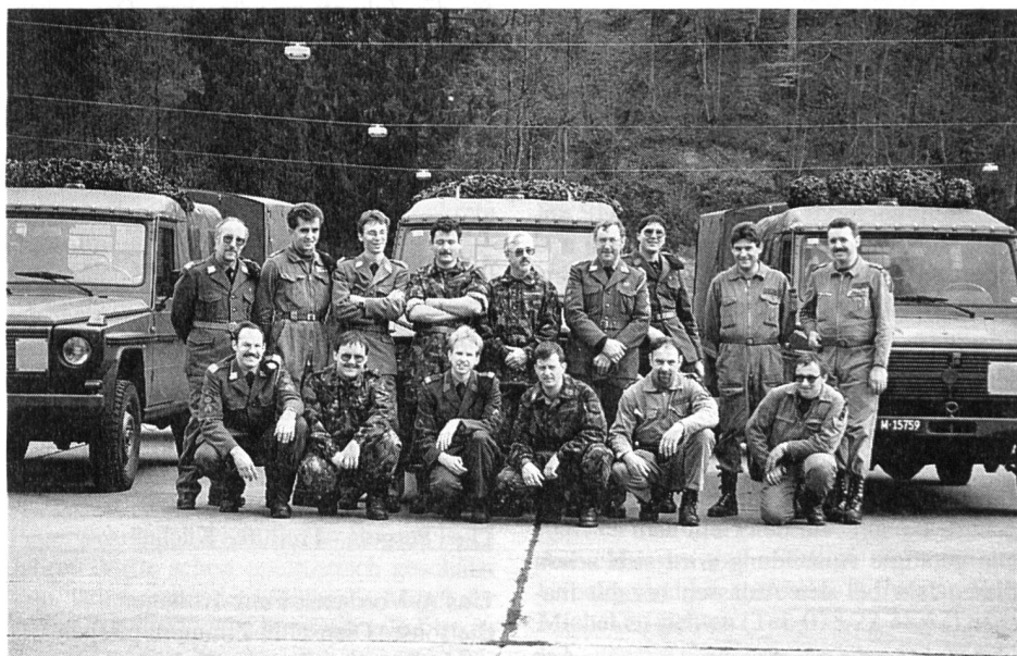
Die Teilnehmer des Puch-Kurses

Die 5 Mitglieder der GMMB zeigten uns, was man beim Parkdienst erledigen muss,