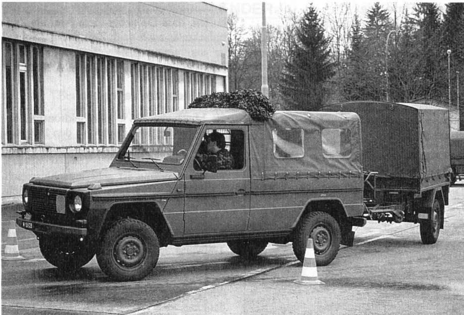
Puchfahren will gelernt sein

wo ist was im Fahrzeug, auf was ist zu achten beim Mitführen des Anhängers..... Nach dem theoretischen Teil an den Fahrzeugen hiess es dann dies in die Praxis umzusetzen.