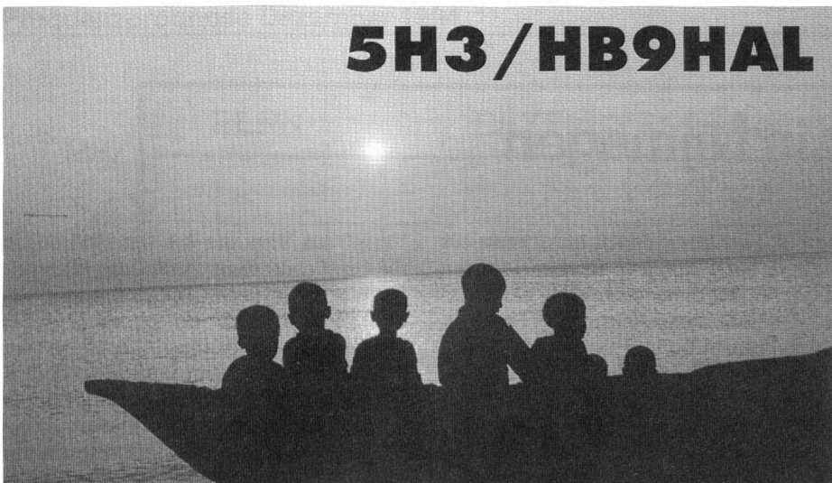
Bstätigungskarte aus Tansania

MHz (auf Kurzwellen) arbeiten möchte, muss bei den PTT eine Morseprüfung mit Tempo 60 Zeichen pro Minute bestehen.