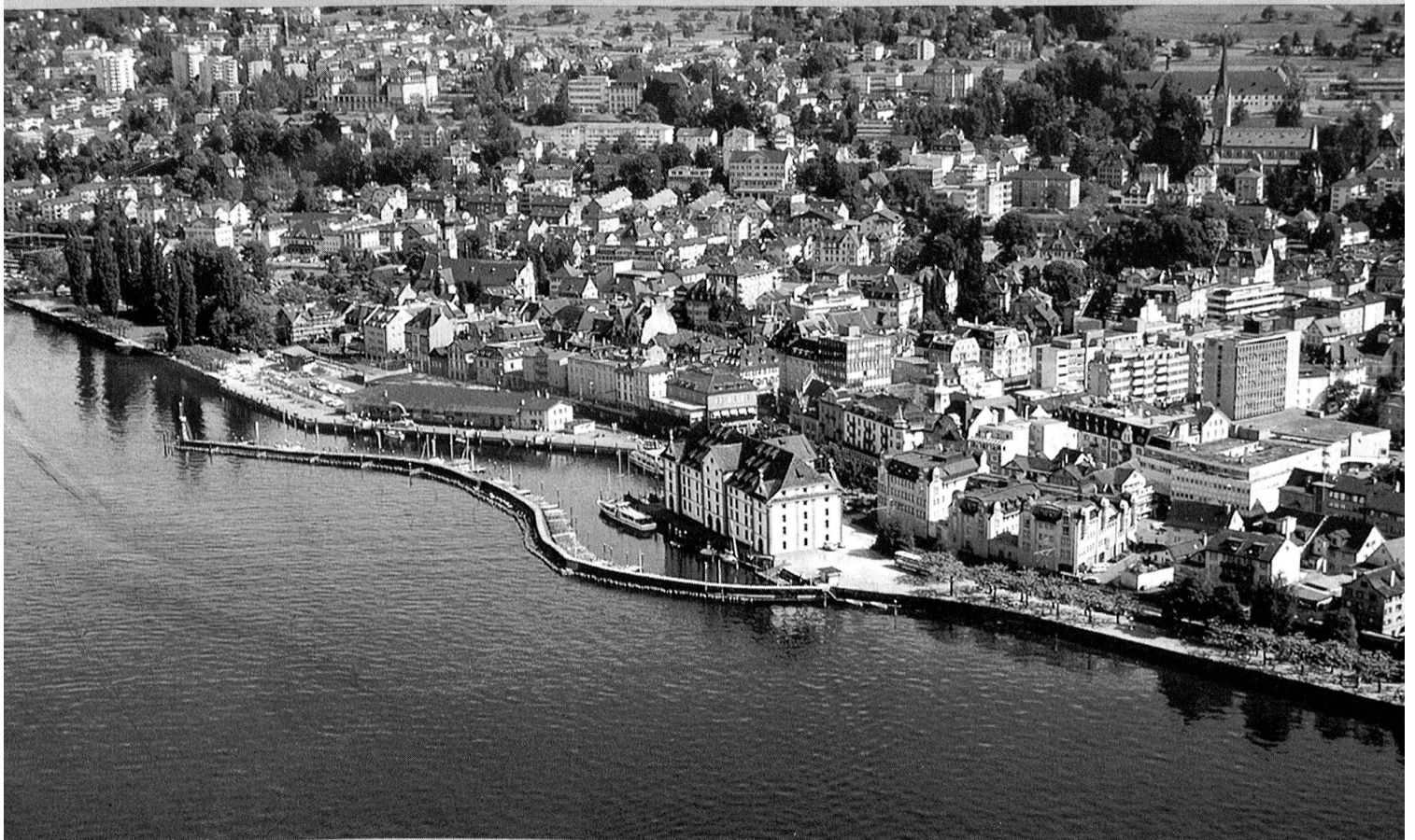
Delegiertenversammlung 1995 in Rorschach

Organo ufficiale dell'Associazione Svizzera delle Truppe di Trasmissione e dell'Associazione Svizzera degli Ufficiali e Sottufficiali Telegrafo da Campo