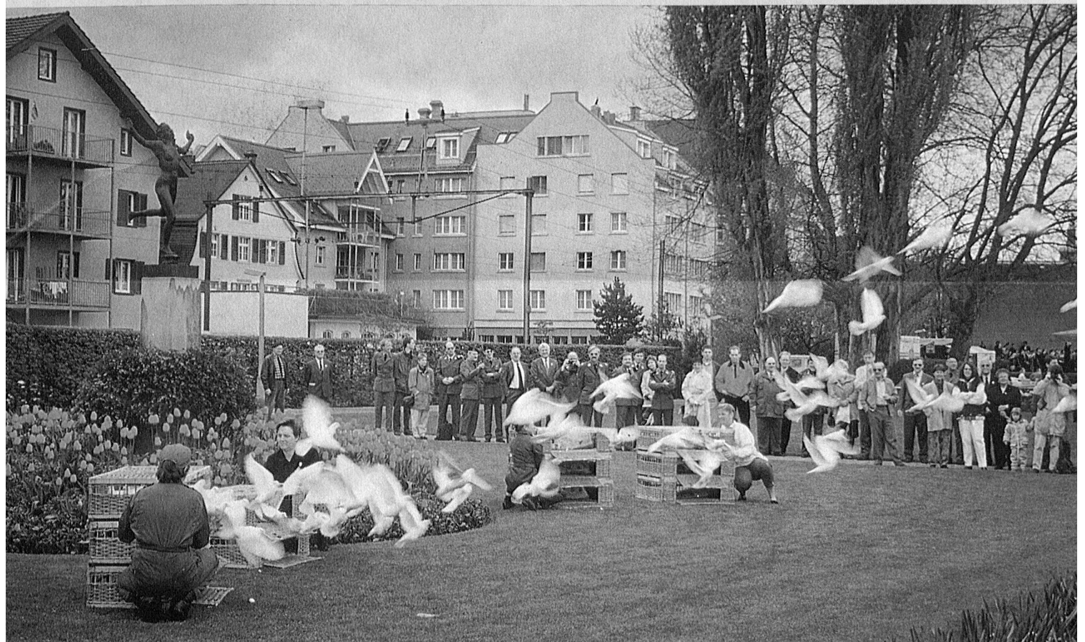
Start zur Delegiertenversammlung in Rorschach

Organo ufficiale dell'Associazione Svizzera delle Truppe di Trasmissione e dell'Associazione Svizzera degli Ufficiali e Sottufficiali Telegrafo da Campo