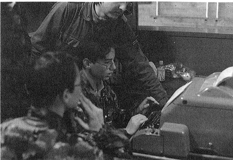
Eingesetztes STG-100 an der PRIMA 96

Nebenbei wurden aber auch Leistungen in anderen militärischen Disziplinen gefordert: Kompasslauf, Sanitätsdienst und Luftpistolenschiessen. So wurde es im Gegensatz zu einigen Funktionären den Kursteilnehmern sicher nicht langweilig, bis am späteren Nachmittag alle wieder glücklich zum Sammelplatz zurückgekehrt waren.