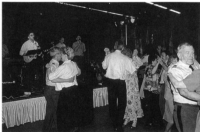
Fröhlich Stimmung durch die Tanzband "Cocktail" während des Abendprogramms.

Der konnte uns mit seinen Kunststücken sehr imponieren. Er liess Armbanduhen von den Handgelenken so-