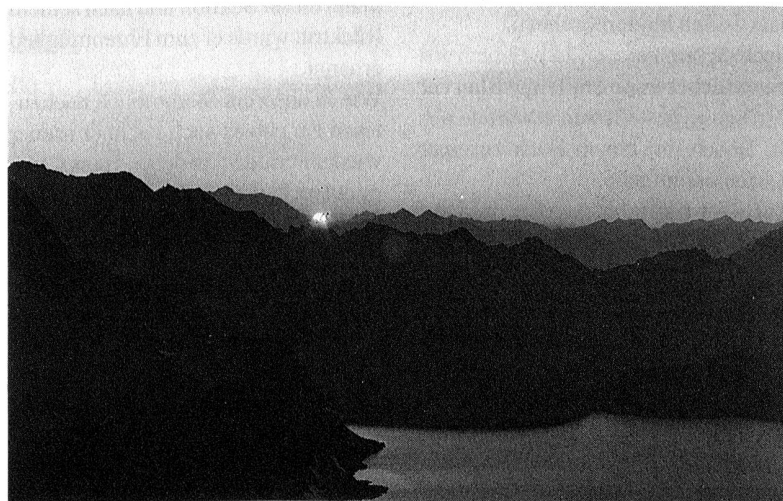
alba sul Naret

Durante una battuta di caccia nella regione del Crisalina, era l'autunno del