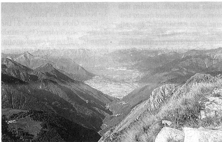
del Cügn a Locarno

questa baracca. E così fu che nel 1970 ricevetti le chiavi e tutto l'arredamento