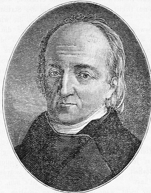
Emanuel von Fellenberg