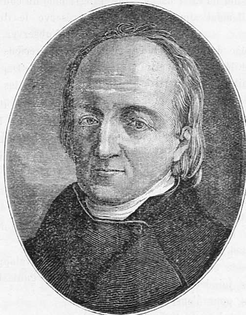
Emanuel von Fellenberg