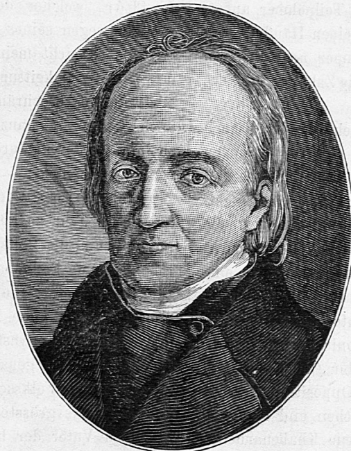
Emanuel von Feilenberg