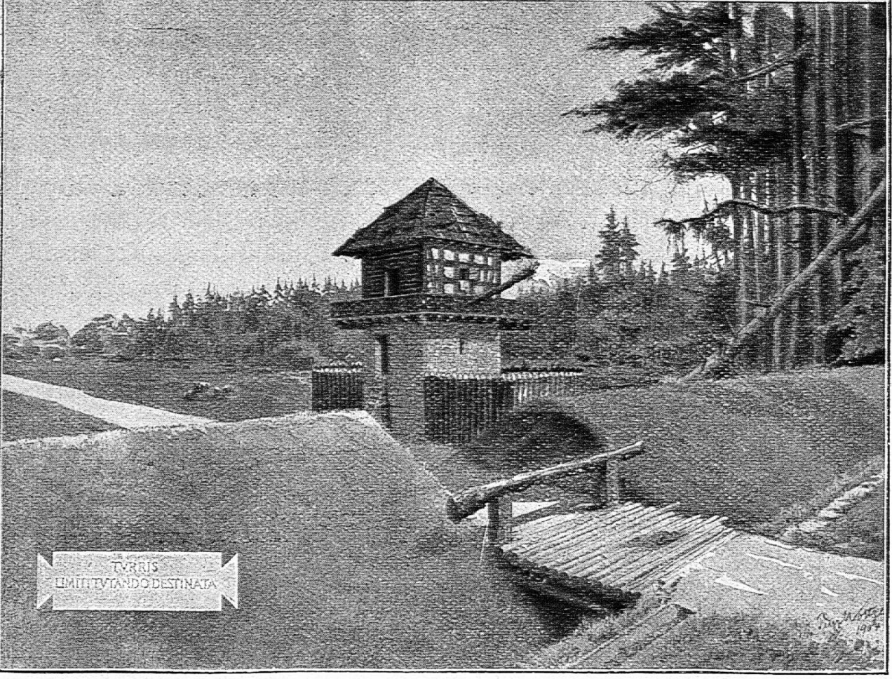
Obere Ecke rechts Pfahlwerk, links Plan des Grenzwall. Unten: Wachturm mit Grenzwall.