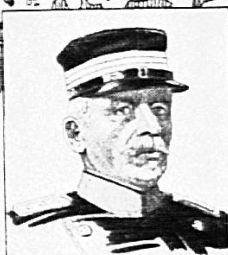
OBERSTKORPSKOMMANDANT WILL KOMMANDANT DER 3. ARMEEKORPS