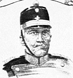
OBERSTKORPSKOMMANDANT WUDTLOH KOMMANDANT DER 1. ARMEEKORPS