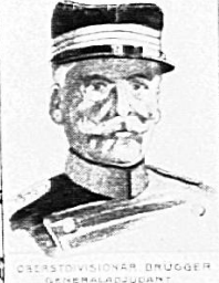
OBERSTDIVISIONAR BRUGGER GENERALADJUTANT