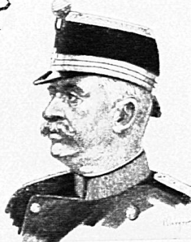
ULRICH WILLE GENERAL DER SCHWEIZER ARMEE