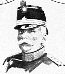
OBERSTKORPSKOMMANDANT JSEVIN KOMMANDANT DER 2. ARMEEKORPS