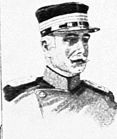
OBERSTDIVISIONAR WILDBOLZ KOMMANDANT DER 2. DIVISION