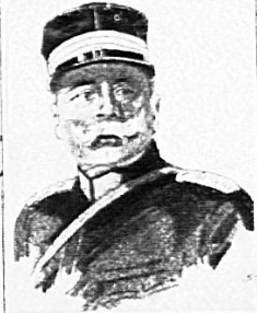
OBERSTDIVISIONAR AD FAMA KOMMANDANT DER BEFESTIGUNGEN VON ST. GAUDENZ