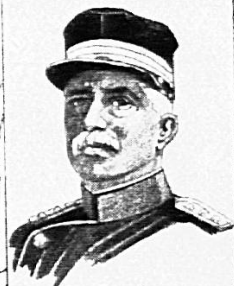
OBERSTDIVISIONAR SCHMID KOMMANDANT DER 4. DIVISION