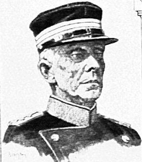
OBERSTKORPSKOMMANDANT TH. SPRECHER VON BERNEGG GENERALSTABSCHEF DER SCHWEIZER ARMEE