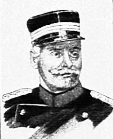
OBERSTDIVISIONAR SCHIESS KOMMANDANT DER DEFESTHÄNDEN AM HAUBERSTEIN