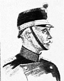
OBERSTDIVISIONAR BÖNARD KOMMANDANT DER 1. DIVISION