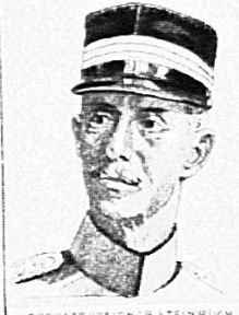
OBERSTDIVISIONAR STEINRÜCK KOMMANDANT DER 4. DIVISION