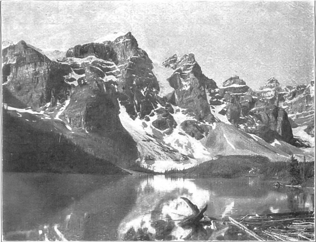
Felsengebirge in Britisch Columbien.