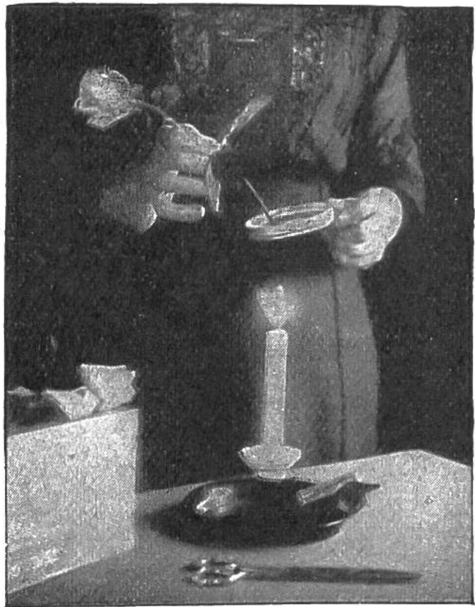
Abb. 1 Das Eintauchen des Stieles in flüssiges Wachs.

sich natürlich auch ihre Frische. Also, man schneidet wohlgeformte, gesunde Knospen vorsichtig vom Strauch, und zwar an einem hellen, trockenen Tage, sobald sie nicht mehr betaut sind. Dann schmilzt man über Licht in einem kleinen Gefäss — man kann zu diesem Zweck einen Dosendeckel aus Metall mit dünnem Draht umwinden und die beiden Drahtenden zu einem Stiel zusammendrehen (s. Abb. 1) — etwas reines Bienenwachs und taucht den glatt geschnittenen Blumenstiel so lange in das heisse Wachs, bis die ganze Schnittfläche sich dick mit der Klebmasse überzogen hat und alle Poren geschlossen sind. Darauf hüllt man jede