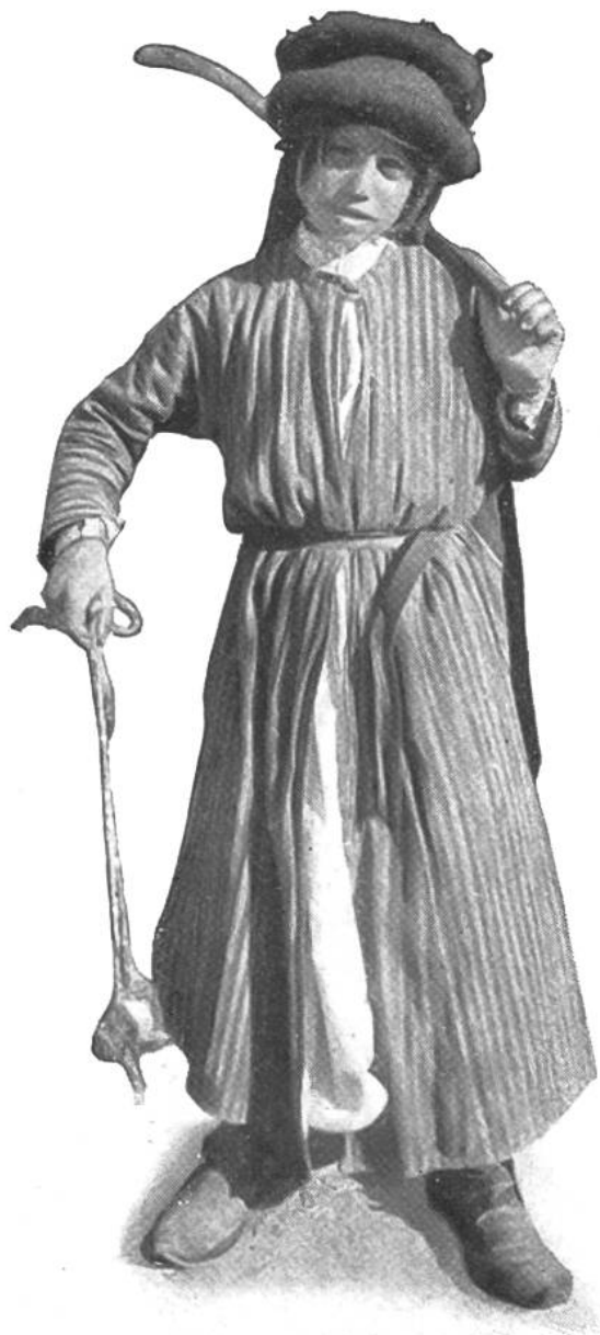
Hirtenknabe mit Stock und Schleuder bewaffnet.

Begegnet der Palästina-Reisende auf seinen Wanderungen einheimischen Schafhirten, gefolgt von ihren Herden, so glaubt er sich in die alten poesievollen Tage versetzt, von