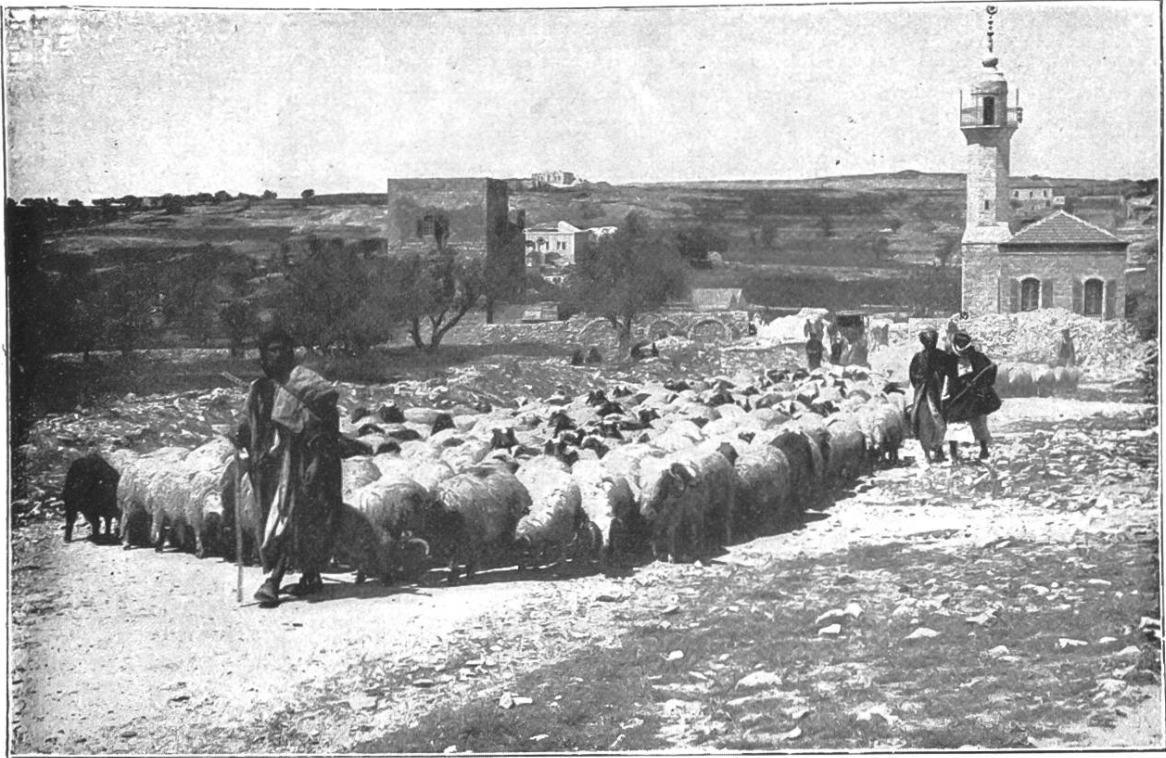
Ein Schäfer führt seine Herde auf dem Wege nach Jerusalem.