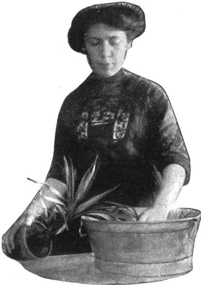
Baden der Pflanzen in Seifen- oder Tabakwasser zur Vertilgung von Schädlingen.

behandeltes Gewächs in ein Gefäss mit lauem Wasser, das bis über den Rand des Blumentopfes gehen soll, gestellt und eine Stunde darin gelassen. Dadurch wird den Wurzeln ermöglicht, die nötige Feuchtigkeit aufzusaugen. Für das gute Gedeihen unserer Zimmerpflanzen ist es ferner unerlässlich, dieselben neben dem gewöhnlichen Begiessen, häufig mit temperiertem Wasser zu betauen, d.h. sie mittelst einer kleinen Brause oder einer kleinen Gartenspritze abzuspülen. Auch sollten die Blätter jeder Pflanze wenigstens einmal im Monat mit lauwarmen Wasser und weichem Schwamm abgewaschen werden. Sind Zier-