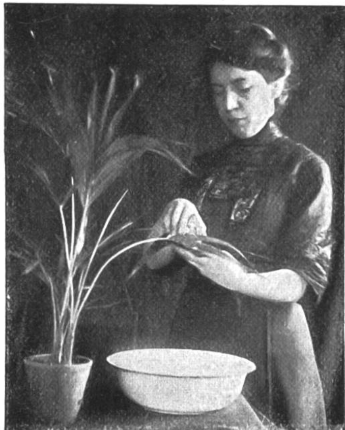
Das Waschen der Palmenblätter.

Grüne Pflanzen sind ein freundlicher Schmuck unserer Wohnräume. Sollen die Zimmerpflanzen aber wachsen und gedeihen, müssen sie auch gepflegt werden. Im allgemeinen werden sie täglich begossen, was jedoch nicht immer ganz das Richtige ist, da nicht alle Arten gleich viel Feuchtigkeit beanspruchen. Einige Pflanzen erhalten dadurch zu viel Wasser, wodurch die Wurzeln leicht faulen, andere dagegen zu wenig, so dass das Innere des Erdballens