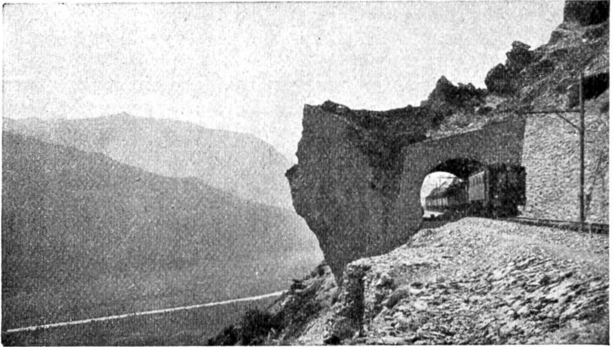
Viktoriatunnel auf der Walliser Seite der Lötschbergbahn; von den Ingenieuren so benannt nach dem links daneben befindlichen Fels, dessen Profil eine erstaunliche Ähnlichkeit mit der verstorbenen Königin Viktoria von England hat; der obere Teil gleicht der von der Königin getragenen Krone.

gewöhnlichen Kieselstein, um seiner natürlichen, schönen Form zuliebe, tausend Franken bezahlen, so würden wir ihn alle einen Narren nennen. In Japan ist es nichts Seltenes, dass von der Natur schön geformte Kieselsteine von Kunstfreunden für zehntausend und mehr Franken erworben werden. Wie etwa bei uns eine wertvolle Statue wird ein solches Stück zu Hause aufgestellt und jedermann bewundert mit Verständnis die Reinheit seiner Linien.