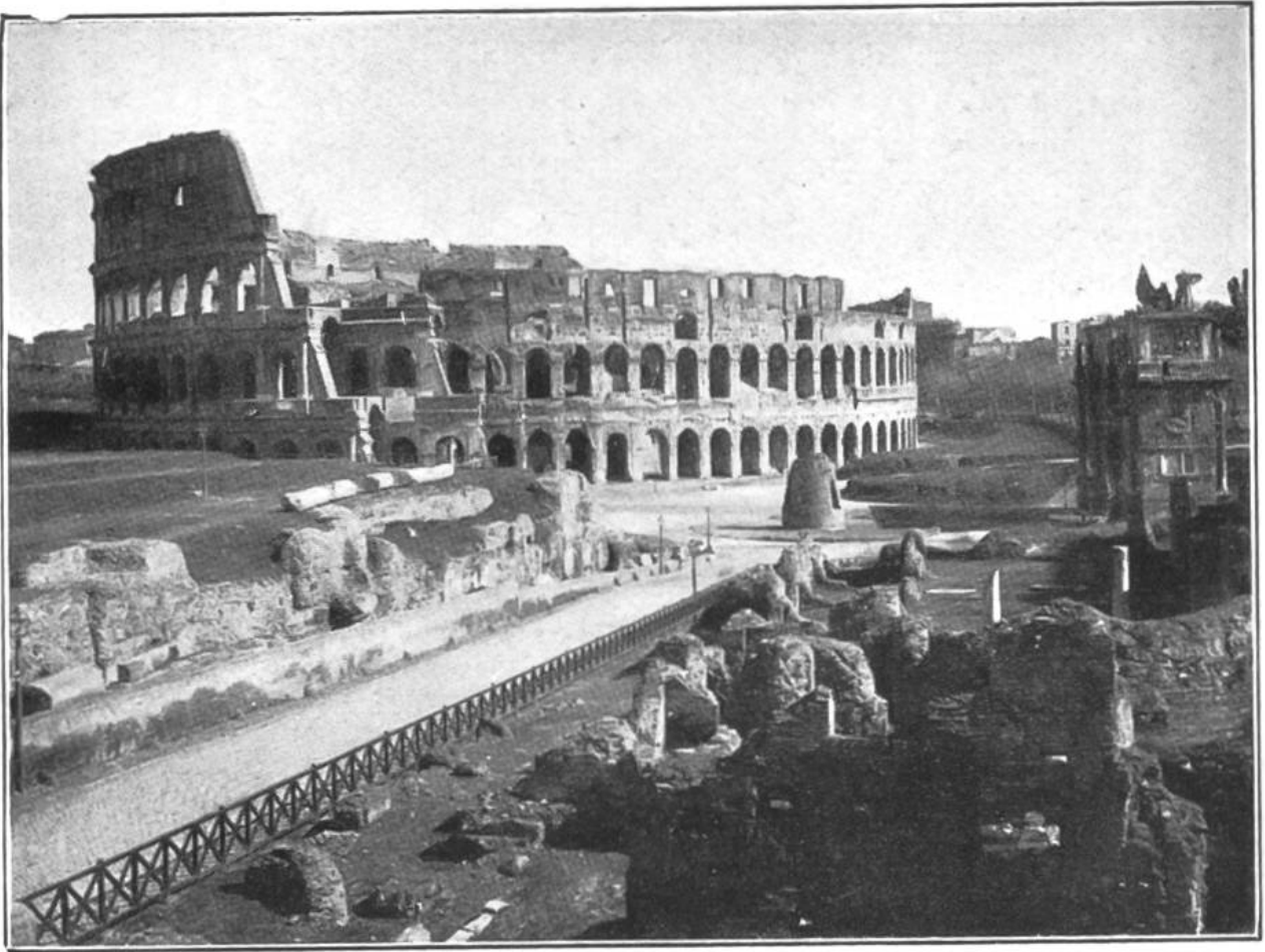
Das Kolosseum, wie es heute noch ist, von aussen gesehen.

breit. Bei Spielen, Tierkämpfen und Theateraufführungen wurden mit eigens gebauten Maschinen Szenerien herbeigeschaffen; mit Sand und Steinen baute man Berge; man liess das Wasser künstliche Teiche bilden; natürliche Bäume wurden in die Arena verpflanzt und bildeten ganze Wälder, in denen sich die Tierkämpfe abspielten. Im Kellergeschoss selbst brüllten in ihren Käfigen die Löwen aus Afrika, die Panther und die Tiger aus Asien, die Bären und die Auerochsen aus Deutschland. Zu den grossen Tierkämpfen traten die Tiere durch eine Falltüre ins Freie, hier wurden sie von Jägern erwartet und zwischen Tier und Mensch entspann sich dann der erbitterte Kampf ums Leben. Nicht immer aber traten bewaffnete Jäger den Tieren gegenüber; in spätern Zeiten besonders waren es wehrlose Christen, die unter den Zähnen der Bestien verbluteten. Die Römer schauten dem Sterben der Christen beifallkatschend zu. Zu andern Zeiten aber traten Kämpfer (Gladiatoren) auf, die entweder im Zweikampf oder im Scharkampf ihre Kräfte massen. Fiel ein Kämpfer, so bat er die Zuschauer, besonders aber den