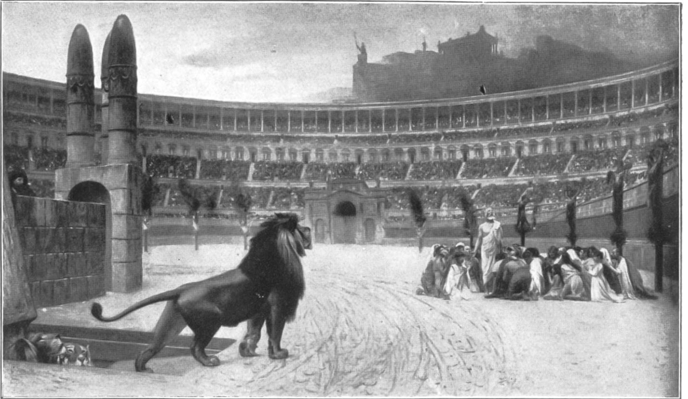
Christliche Märtyrer vor den Löwen des Kolosseums.