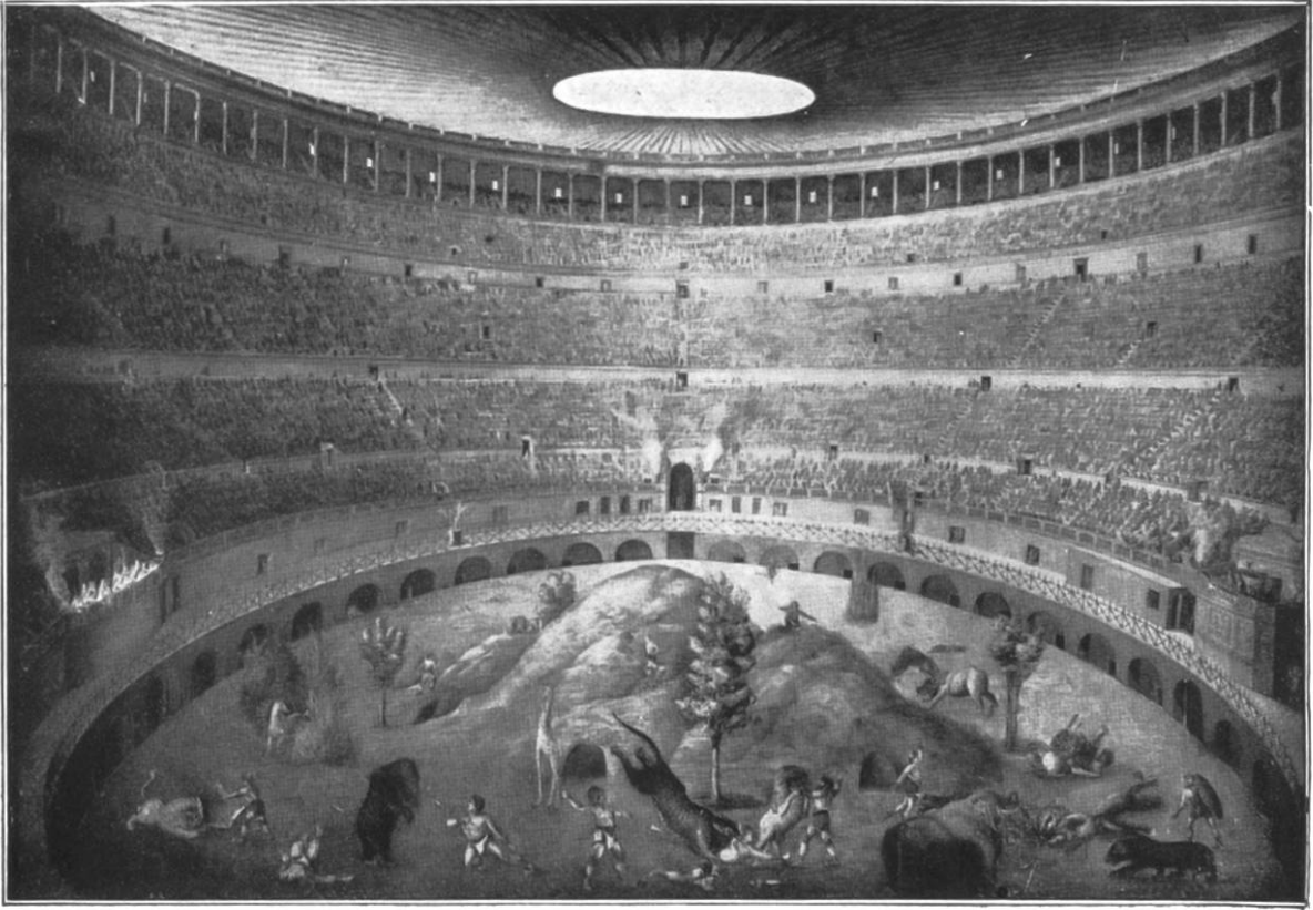
Tierkämpfe im Kolosseum.