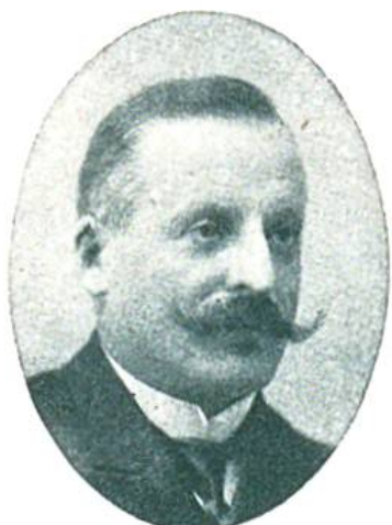
Dr. Giuseppe Motta v. Airole geb. 1871, seit 1912 i. Amte.