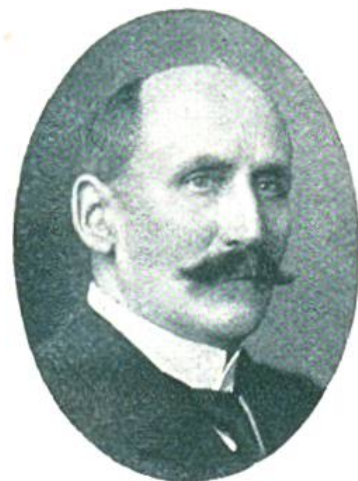
Dr. Felix Calonder von Trins, Grbd. geb. 1863, seit 1913 i. Amte.