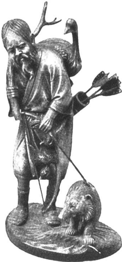
Mongolischer Jäger mit zur Jagd abgerichtetem Raubvogel und Bären.

Wildgans und der Hase nicht von den Hunden, sondern von Falken, Sperbern und Habichten gejagt. Man zähmte diese Tiere durch Hunger und gewöhnte sie durch liebevolle Pflege auf der Hand des Falkners sitzen zu bleiben. Bevor man zur Jagd ritt, wurden dem Falken mit einer Kappe die Augen verbunden; nachdem man am Jagdplatz angekommen war und dem Falken die Lederhaube abgenommen hatte, warf man ihn in die Lüfte, wo er nun sofort so hoch stieg, dass er auf alles Wild herabstossen konnte. Ein Glöcklein am Fusse des Falken zeigte an, wo er sich befand. Jeder Adelige suchte sich gute Jagdfalken zu halten. Riesige Summen wurden dafür verschleudert. Philipp August, König von Frankreich, belagerte auf dem dritten Kreuzzug (1189—1192) die Stadt Akkon. Da flog sein weisser Falke ins Türkenlager hinüber; um ihn wieder zu erhalten bot der König 1000 Goldgulden.