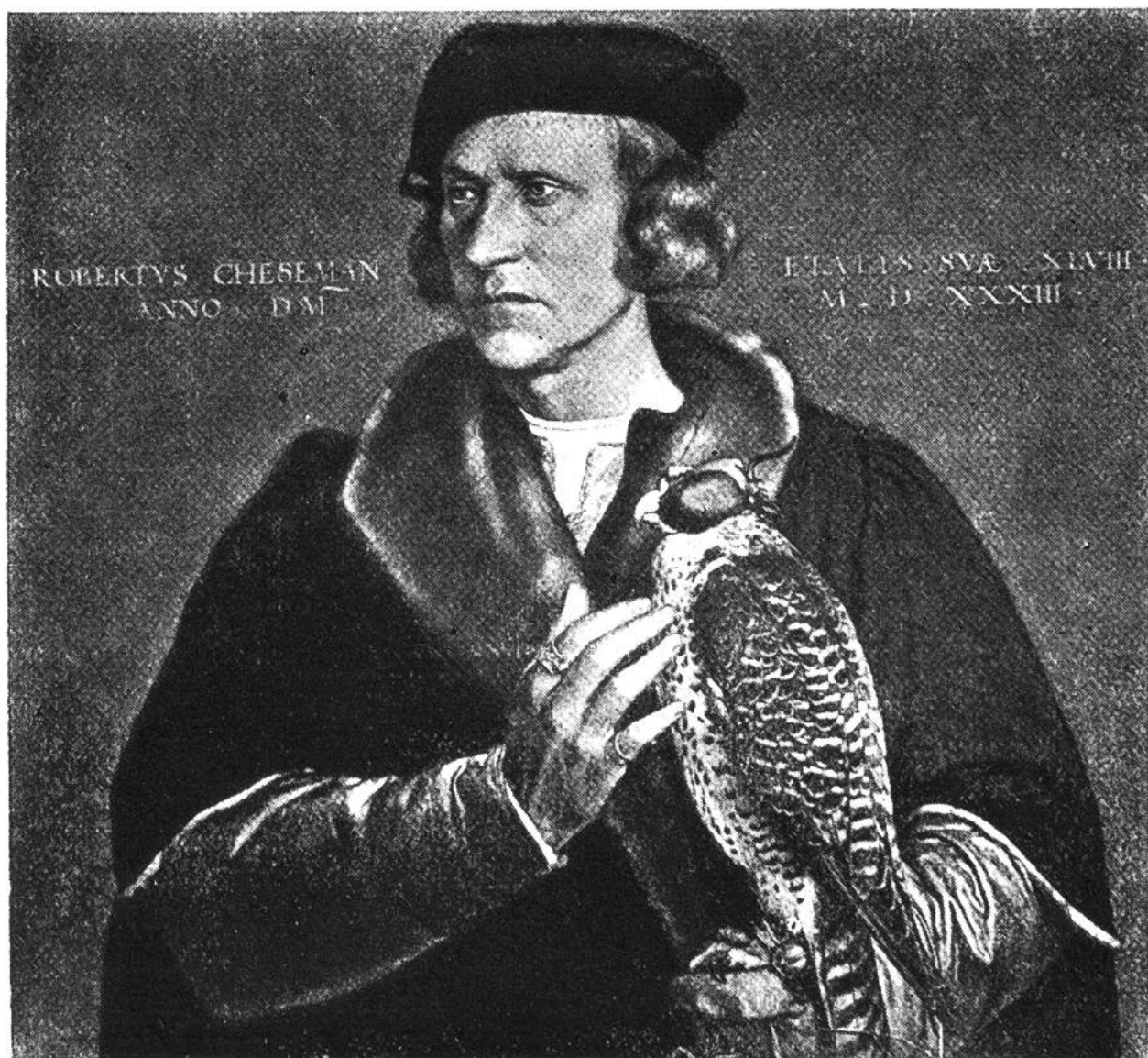
FALKNER HEINRICHS VIII. Gemälde von Hans Holbein.

Der treueste Jagdgefährte des Menschen ist der Hund geworden. Es gibt wohl fast keine jagdbare Tierart mehr, auf die nicht der Hund dressiert worden wäre. Er eilt als arabischer Windhund der flinken Gazelle nach und schlüpft als krummbeiniger Dachshund in Dachs- und Fuchsbauten; er greift Wolf, Löwe und Wildschwein an und jagt im Sumpf Enten und Hühner. Heute kann der Jäger in unsern wildarmen Gegenden nicht ohne den Jagdhund auskommen. Im Mittelalter freilich, als die Jagd nur den Adeligen gestattet und den Bauern bei den qualvollsten Todesstrafen (Jagdfrevler wurden lebendig auf Hirsche geschmiedet) verboten war, da wurden der edle Königsreiher, der Kranich, die Ente, die