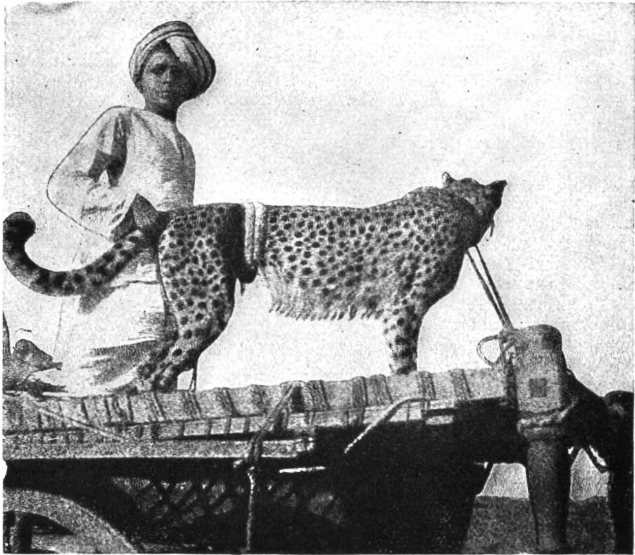
Fahrt zur Jagd mit dem „Tschitah“, dem gewandten Jagdgehilfen der Indier.