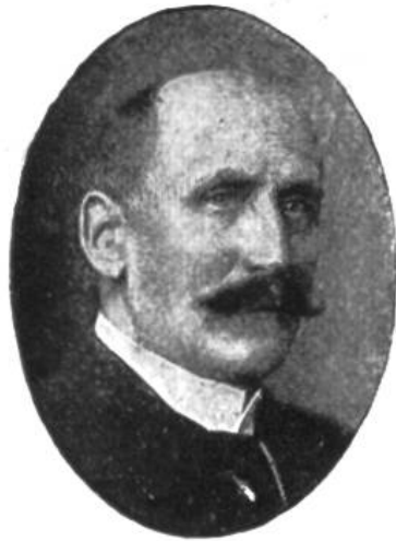
Dr. Felix Calonder von Trins, Grbd. geb. 1863, seit 1913 i. Amte.