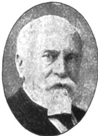
Gustave Ador von Genf geb. 1845, seit 1917 i. Amte.