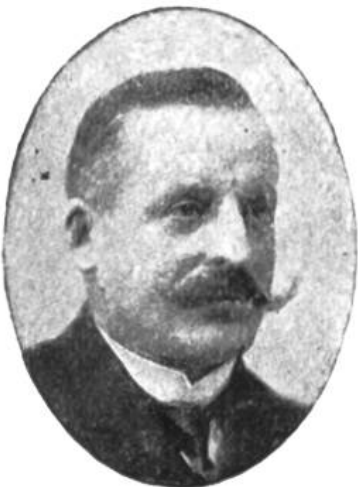
Dr. Giuseppe Motta von Airolo geb. 1871, seit 1912 i. Amte.